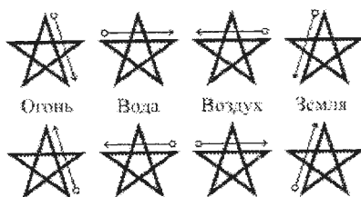
Рис. 1. Призывающие (вверху) и изгоняющие (внизу) пентаграммы в учении «Золотой Зари»

позволяло превратить ее в символ «вызова» или «изгнания» соответствующего элемента.